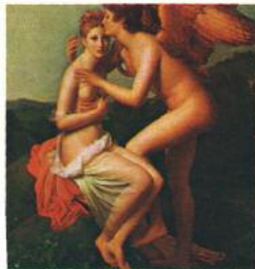
EROS Y PSIQUE

- Δεῖ κυρίους εἶναι τοὺς νόμους τοῖς πολίταις.